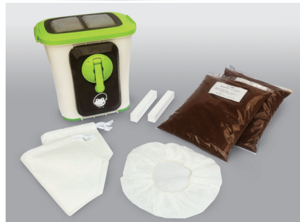
室内型家庭用生ごみ処理機

毎日投入しても、中身の量はほとんど増えません チップ材は4~5ヶ月ごとに半量だけ交換 一度使ったチップ材は2~3回再利用が可能